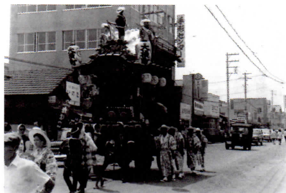
本町通り (旧市役所まえ) の大横町山車 (後ろにジープが・・・)