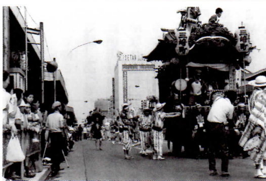
甲州街道の三崎町山車 (伊勢丹がありました)