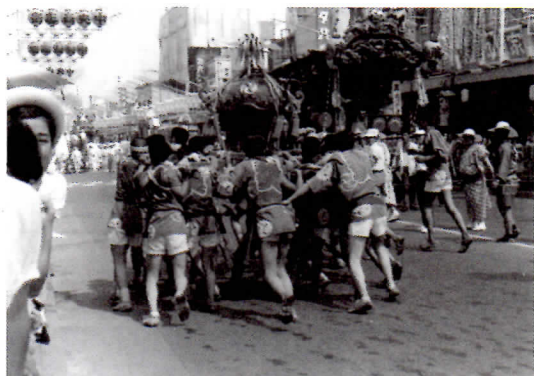
甲州街道の南町山車 (神輿はわっしょい! でした)