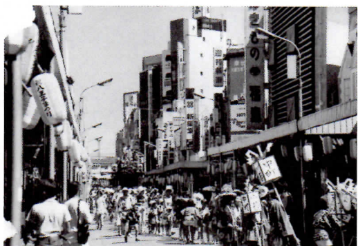
中町山車 (アーケードのあった西放射線)