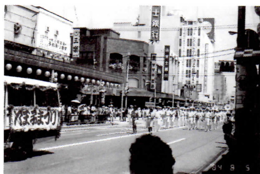
八王子まつりパレード (八日町交差点) (大丸デパートがありました)